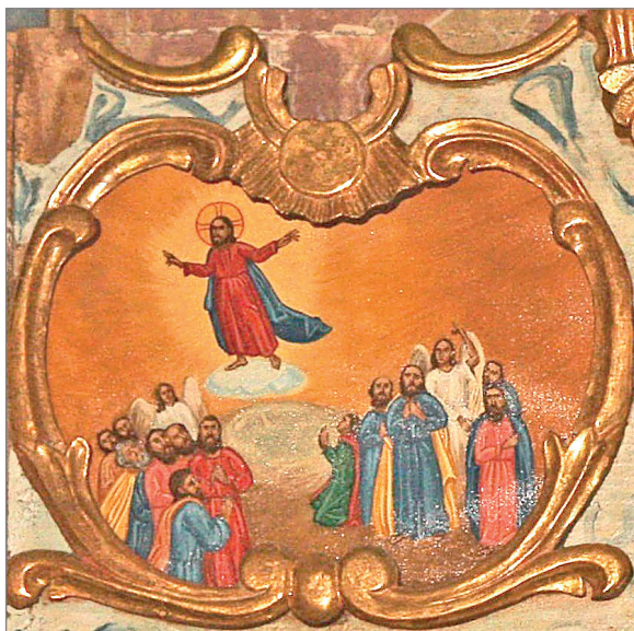
Wniebowstąpienie Pana Jezusa Ikona świąteczna z kościoła w Górzance