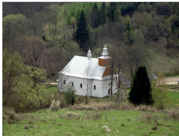
Cerkiew w Łopience

Szczegółowy przebieg tras turystycznych dostępny jest na tablicy przy kościele.